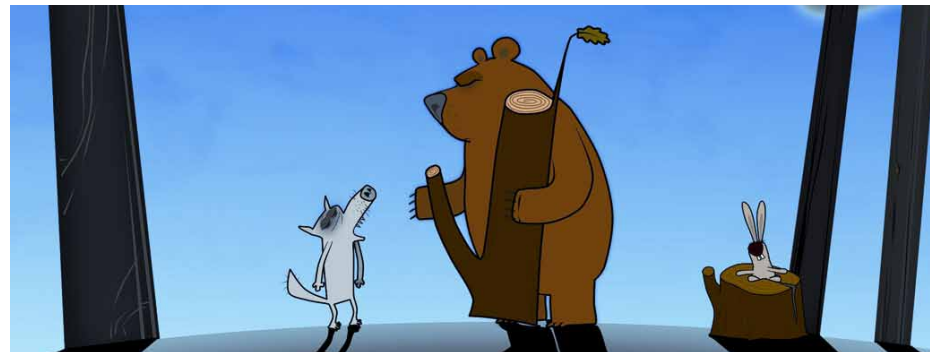
Filmausschnitt: Log Jam (The Eagle / Moon)

Unglaublich komisch! Zugegeben ein Männerfilm!