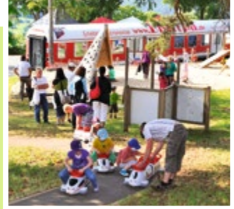
Spiel & Spaß für Kinder