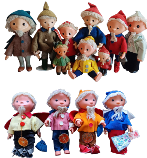
Abbildungen: Sandmännchen aus den ersten Jahrzehnten. Sammlung Wilski & Wilkening

Bald nach den ersten Ausstrahlungen im Fernsehen wollte jeder ein Sandmännchen haben oder verschenken. Kleine Handwerksbetriebe passten ihre Puppen an und produzierten teilweise ohne Genehmigung. Das Fernsehen der DDR erkannte den Wettbewerb und kontrollierte die Qualität wie ein Markenprodukt. Die Kultfigur lässt sich bis heute schwer vervielfältigen. Was zeichnet die Figur aus? Welches Material eignet sich? Stehen die Puppen im Schrank oder können Kinder damit spielen? In Kleinbetrieben entstehen andere Figuren als bei der Großproduktion. Die Leipziger Messe war Treffpunkt für Inland und Export. 65 Jahre Sandmännchen-Puppen erzählen von einer wechselvollen Spielzeug-Produktion und Geschichte.