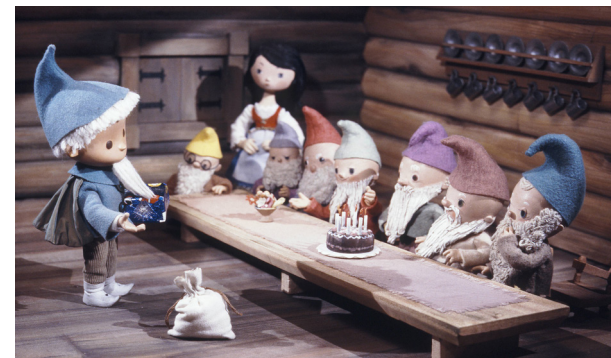
PU 244 Schneewittchen

Do, 06.02. & Do, 06.03.2025, 13-16 Uhr Offener Workshop für Kinder Wir basteln unsere eigene Sandmann-Handspielpuppe. Material: 4,00 EUR zzgl. Eintritt