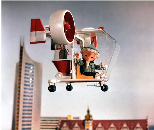
PU 366 - 1970 Leipziger Messe / Spielzeugabteilung / Senkrechtstarter