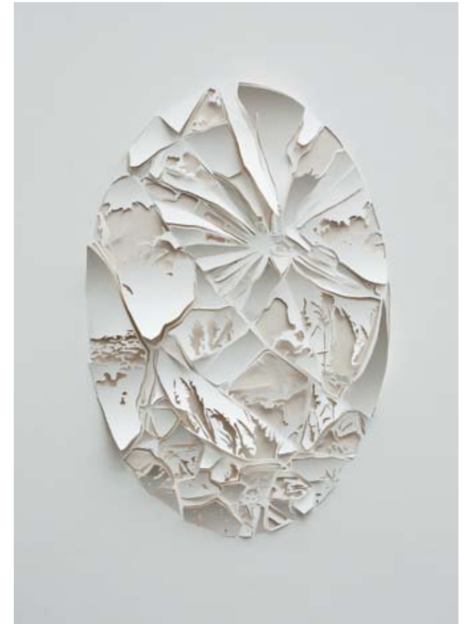
Spiegel , Papierschnitt, 50 x 60 cm, 2008

Wir laden Sie und Ihre Freunde ganz herzlich zur Ausstellungseröffnung am 15. März 2013, 20 Uhr in die Galerie im Bürgerhaus Zella-Mehlis ein. Der Künstler ist anwesend und spricht über seine Werke.