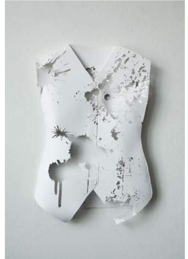
Weste , Papierschnitt/Papierobjekt, 65 x 40 cm, 2008