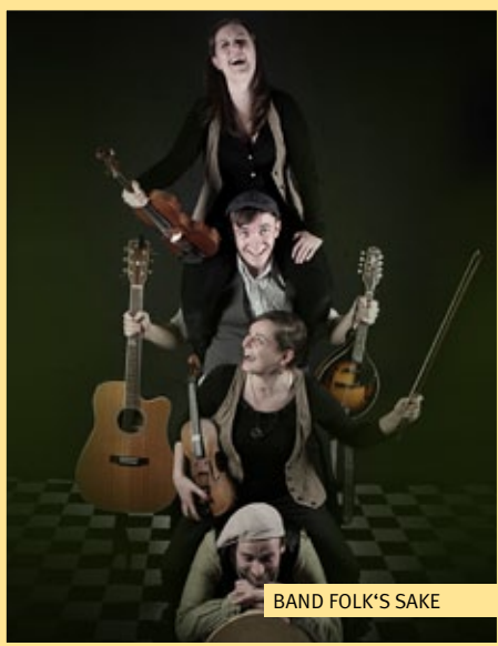
BAND FOLK'S SAKE